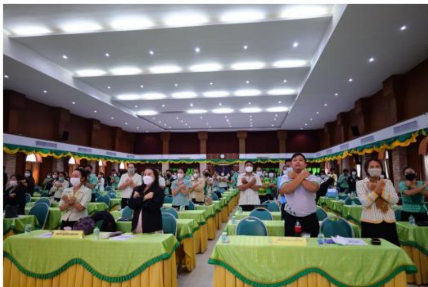
ที่มา : การประชุมครูและบุคลากรทางการศึกษา ตลอดปีการศึกษา