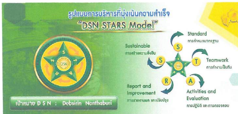
รูปแบบการบริหารงาน (HAPPY SCHOOL Model)